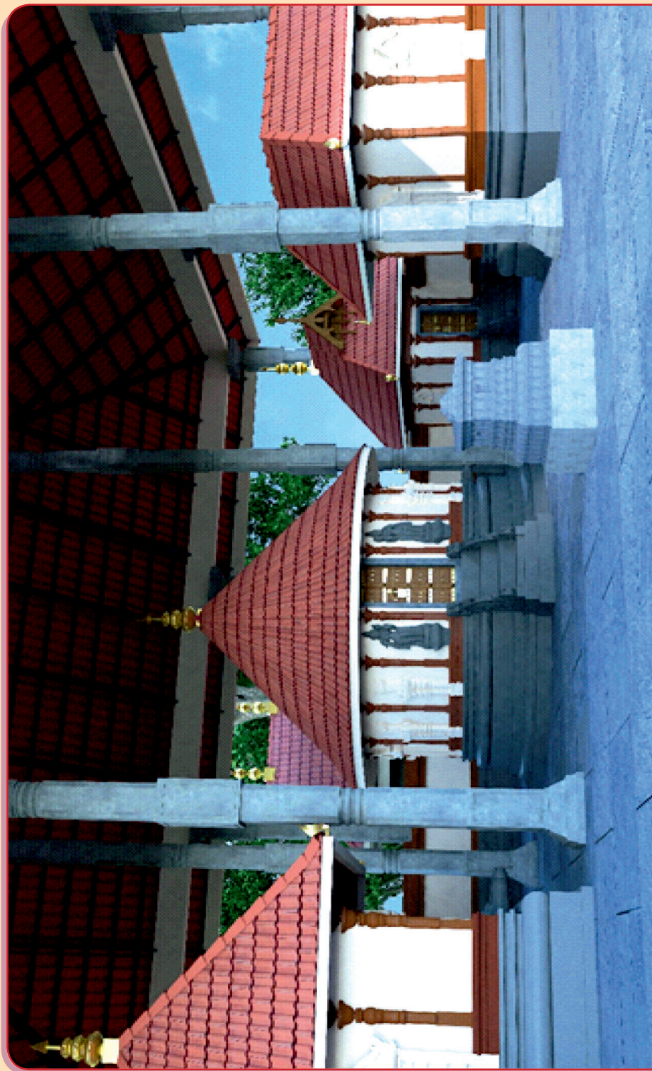
PROPOSED TEMPLE (INSIDE), AFTER RENOVATION