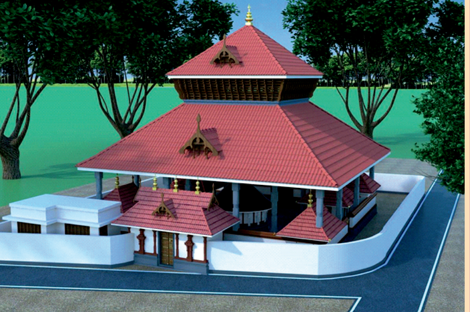
Proposed Temple, after Renovation